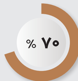
سهم خوراک دام در هزینه تمام شده محصولات پروتئینی